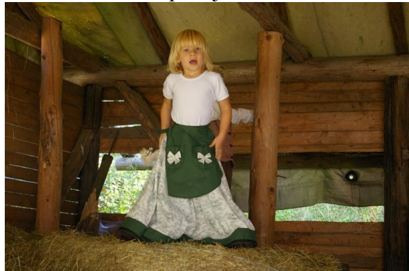
Blbnutí na seně ☺

příliš nápadná dominanta, která je viditelná z celého městečka a přebíjí i místní kostel.