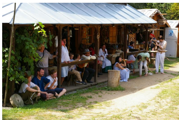
General Store Beaver City