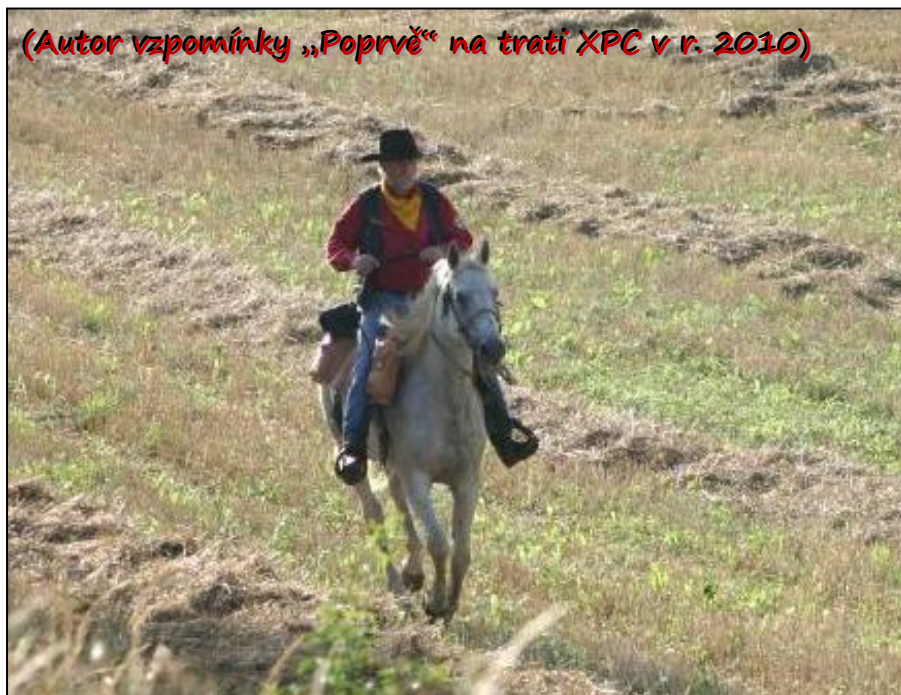
(Autor vzpomínky „Poprvé“ na trati XPC v r. 2010)