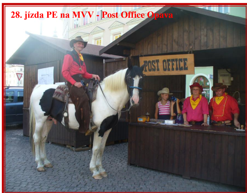
28. jízda PE na MVV - Post Office Opava