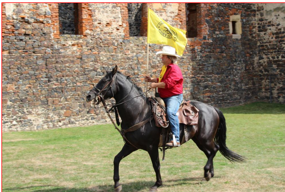
Hrad Švihov – R. Paul

Pošta na Slovensko pokračovala dál, bohužel na Polských hranicích žádný polský jezdec, ani organizátor nebyl, a tak se polský Pony Express po 22 letech bez jakékoli zprávy nerealizoval. Počasí si pro nás letos připravilo všechny svoje tváře, od úmorného vedra v Čechách, které šplhalo vysoko přes 30 stupňů, až po lijáky, průtrže a bouřky na Moravě.