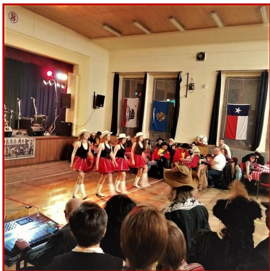
Cowpackův bál Strančice