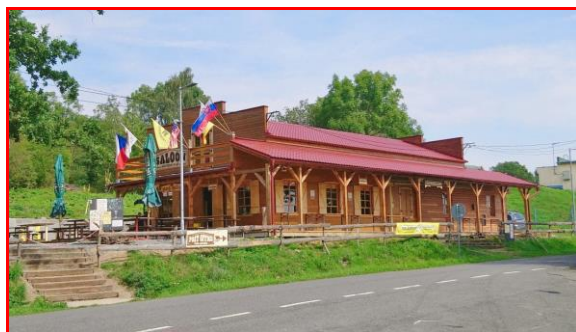
Lidka Tošovská