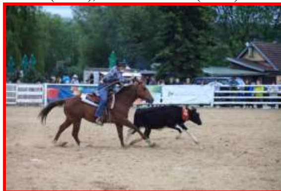
Ranch Roping

Urban, který zalasoval za 13:12, druhý byl R. Santana (16:06), třetí P. Řeháček (16:84).