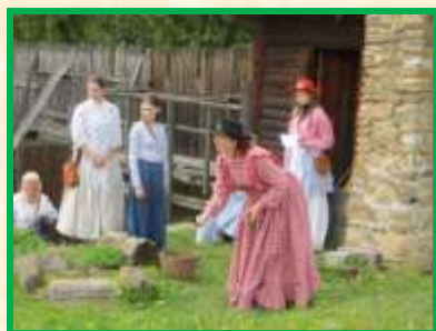
28. červenec – 6. srpen 2017 Táboření na Fort Beaveru (TC) Tradiční táboření spojené s akcemi BC a WI-CZ.